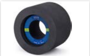
● ラバーコントロール砥石