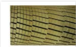
● スパイラルロール砥石