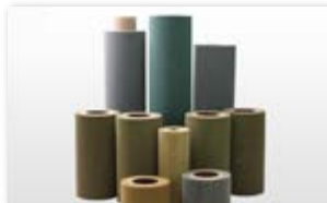
● Gフラップホイール