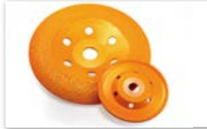
● 溶着ダイヤモンドオフセット砥石