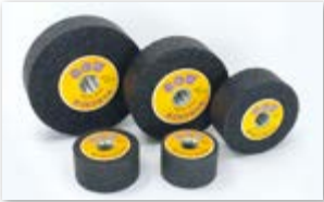
● インターナル標準型砥石(レジノイド)