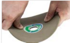
● 高弾性ゴム研削砥石