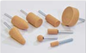
● 軸付砥石(ビトリファイド)