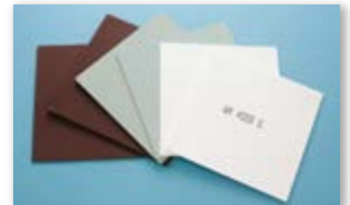
● ドレスボード(ビトリファイド / レジノイド)