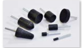
● 軸付砥石(レジノイド)