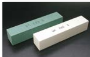
● ドレッシング砥石(ビトリファイド)