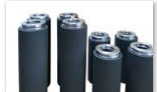
● ニューラバーローラー