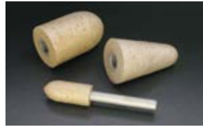
● ソフトメタルダイヤモンド砥石