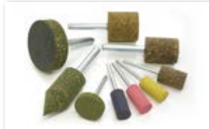
● 軸付ハイブリッドゴム砥石