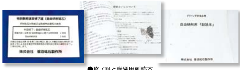
●修了証と講習用副読本